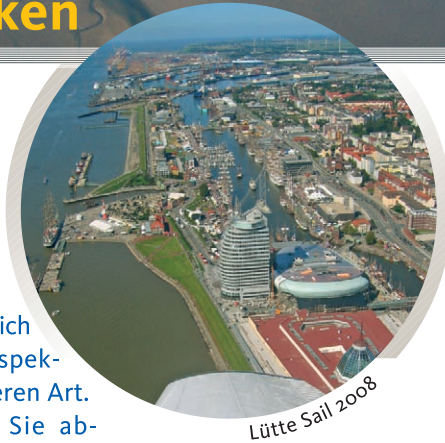
Lütje Sail 2008

Inseln liegen uns zu Füßen. Sie lassen sich faszinieren von der schier unendlichen Weite, der ungewöhnlichen Perspektive – der neuen Sicht der Dinge.